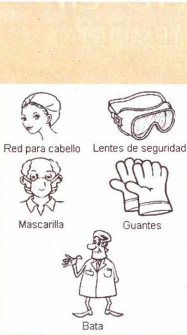
Equipo de protección en un archivo 7