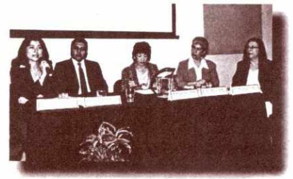
Integrantes mesa redonda

Área de Registro del Departamento de Registro y Estadística, División de Desarrollo Organizacional, Unidad de Salud y Biblioteca Central. Asimismo, personas particulares interesadas en el tema.