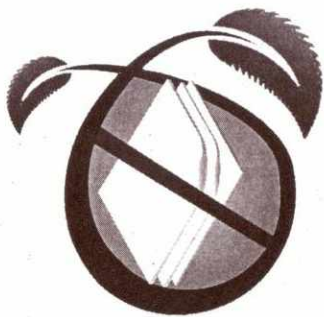
Reducción del tamaño de documentos