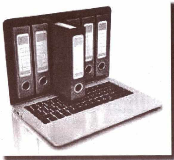
Archivo sin papel

Es importante considerar que para cualquier proceso de implementación, cambio u optimización es indispensable conformar un equipo interdisciplinario, que posea el siguiente perfil: un especialista en el área de gestión documental, uno en el área de procesos y otro en informática.