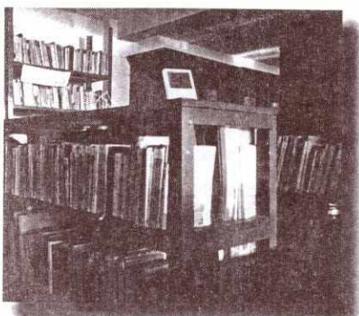
Biblioteca Municipal de San Juan Sacatepéquez.