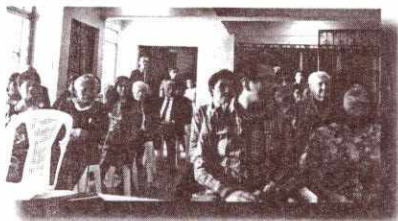
Clausura de la actividad.

Se impartió la capacitación Manipulación de libros antiguos y elaboración de contenedores , a estudiantes de la Escuela de Historia, el día 2 de septiembre. Esta actividad formó parte del rescate y organización de la Biblioteca Municipal de San Juan Sacatepéquez, que realizó personal y estudiantes de la escuela. Imágenes 1 y 2.